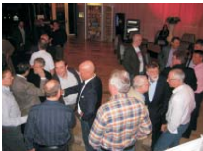
Vilka är vanliga hotellgäster?