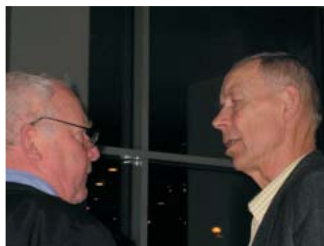
“Sakta i backarna! den där historien tror jag inte på”