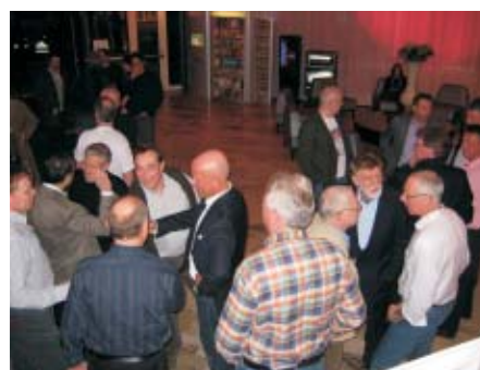
Vars är brudarna?