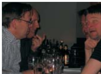
Öl smakar lika gott som för 30 år sedan - och ögonen blir lika röda.