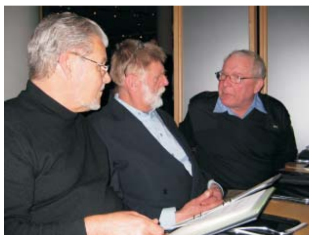
“Sakta i backarna! den där historien tror vi inte på!”