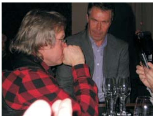
Nelson får onda ögat