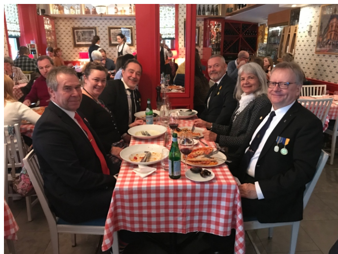
Intet ont anande...