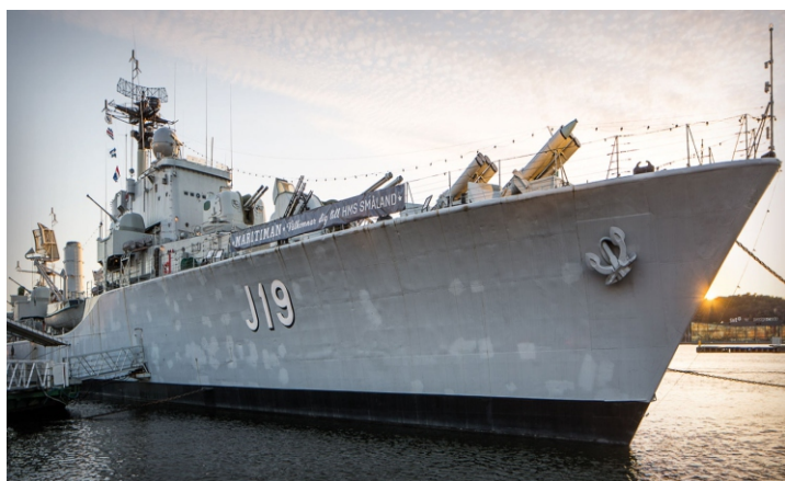
HMS Småland vid kaj.

stoltheten: Göta Älvsbron, eller 12:an som den också heter (eftersom den går över älva...(göteborgsskämt)). Kodera öppnade sidofönstret och kastade ut kvarlåtenskapen av den ruppade uttern, som ändamålsenligt sög till sig de två robotarna vilka exploderade med ett resolut PLADANK! Nu till själva planen för attentatet: Kodera kände igen plasthandtaget från när han var liten. På den tiden drog man hårt i det vilket medförde att en snurra sköt iväg uppåt. På AWACS var det tydlig likadant, men handtaget var något större. Plötsligt ser Kodera spår från luftvärnet på jagaren HMS Småland. Vad i HELVETE! Den båten har legat i