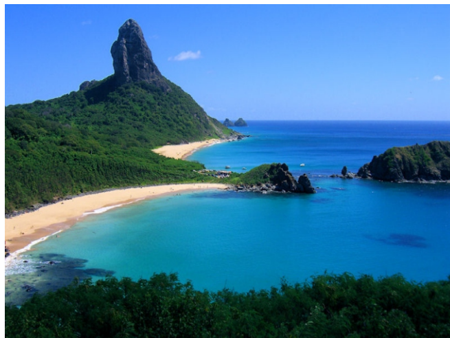
Fernando de Noronha i full skrud.

den glupska hajen skulle få för sig att käka svenska flottister och förmodligen tugga sig in från kanten. Så det var djäkligt trångt i mitten. Men som ni nog fortfarande kommer ihåg så klarade vi oss fint och väl uppe i livbåtarna så kändes det riktigt skönt.