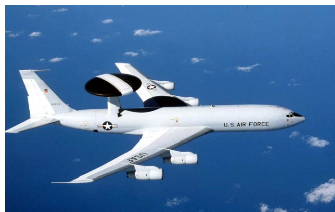
Ett AWACS-plan kostar flera tusen kronor.

trodde stod US Airforce AWACS-plan tillgängligt, förutom en förvirrad vakt som Kodera bet av huvudet på. Spakarna var inget problem - men den stora disken ovanför planet kände han inte igen. Han startade motorerna och valde taxibana C. Kodera kände för första gången på 5 år en aning av lycka. Lyckligtvis var han avlägset bekant med flygledaren i tornet; Akira Kurozawa som omedelbart gav tillstånd för start. Kodera förde reglagen framåt och med ett olidligt vrål lättade