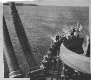
T. A.: Så här ligger minorna utgräddade på däck. Fällningens förslupp är löst skjutet ut.

Hur det går till att fälla minor och ta upp dem igen beskrivs i denna skildring av flottans män i vardagsjobb.