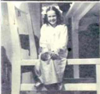
En rar dockflicka i Filmos nya sagofilm, som nu inspelas. maj