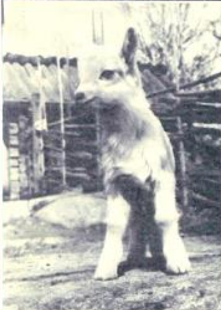
En käck nykomling bland våra favoriter på Skansen.