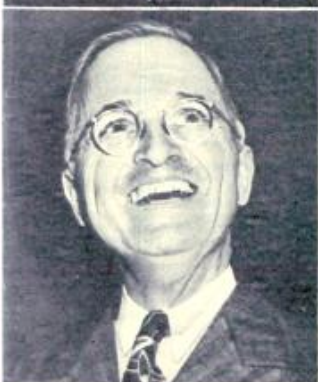
Den nye presidenten i Förenta Staterna — Harry Truman.